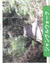
シャングリラウォーク 熱帯雨林を散策。